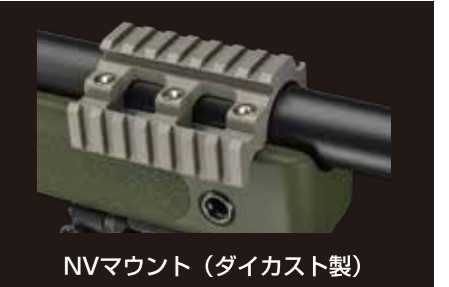
NVマウント (ダイカスト製)