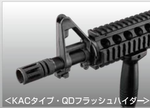
<KACタイプ・QDフラッシュハイダー>