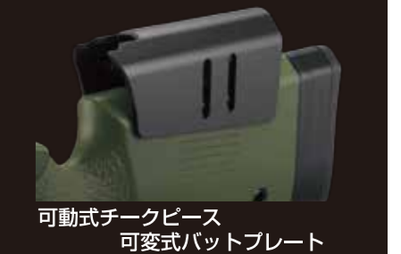
可動式チークピース 可変式バットプレート