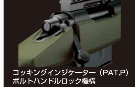
コッキングインジケータ (PAT.P) ボルトハンドルロック機構