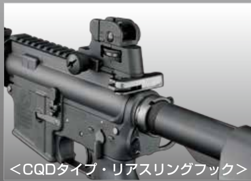
<CQDタイプ・リアスリングフック>