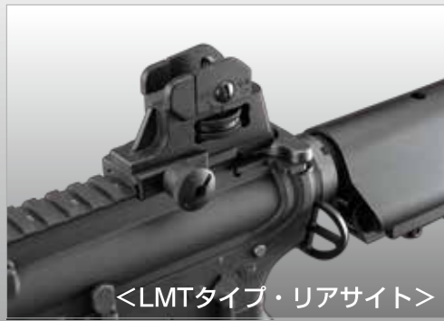
<LMTタイプ・リアサイト>