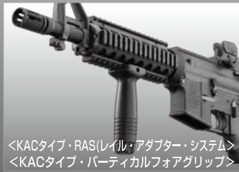
<KACタイプ・RAS(レール・アダプター・システム)> <KACタイプ・バーティカルフォアグリップ>