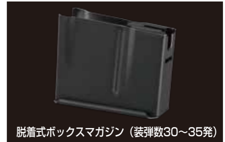
脱着式ボックスマガジン (装弾数30~35発)